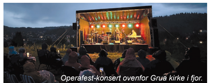
Operafest-konsert ovenfor Grua kirke i fjor.

Hadeland Janitsjar inviterer til kirkekonsernt i Lunner kirke lørdag 26. april kl. 16. Gratis inngang. Variert og fint program.